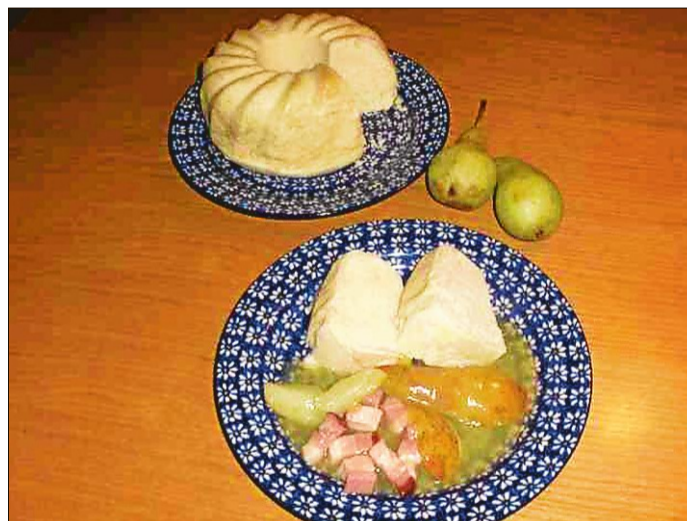
In einer Silikon-Gugelhupfform kommt der Hüdel etwa acht Minuten in die Mikrowelle – dazu gibt's Birne.