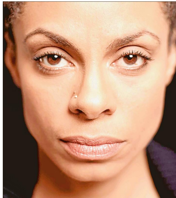
Eine der großen deutschen Soulstimmen: Astrid North.

Ein Konzert mit den beteiligten Künstlern gibt es dann um 19.30 Uhr. Eine After-show-Party schließt sich an. Tickets für das Konzert in der Jugendherberge Esens gibt es in den ServiceCentern von Harlinger und Wochenblatt – mit Mehrwertkarte vergünstigt für 13,50 statt 15 Euro.