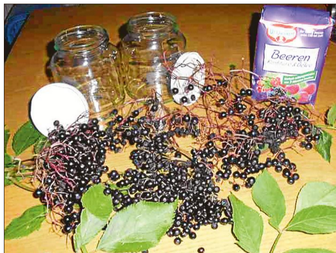
Für ein leckeres Holundergelee braucht es nicht viel: lediglich die Beeren, Gelierzucker, etwas Wasser und Gläser.

Danach den Teig in eine gefettete Kastenform geben und die Äpfel drunter verteilen. Das Ganze bei 160 Grad Celsius etwa 50 Minuten aufbacken.